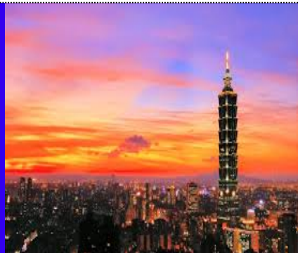
Tháp 101 taipei